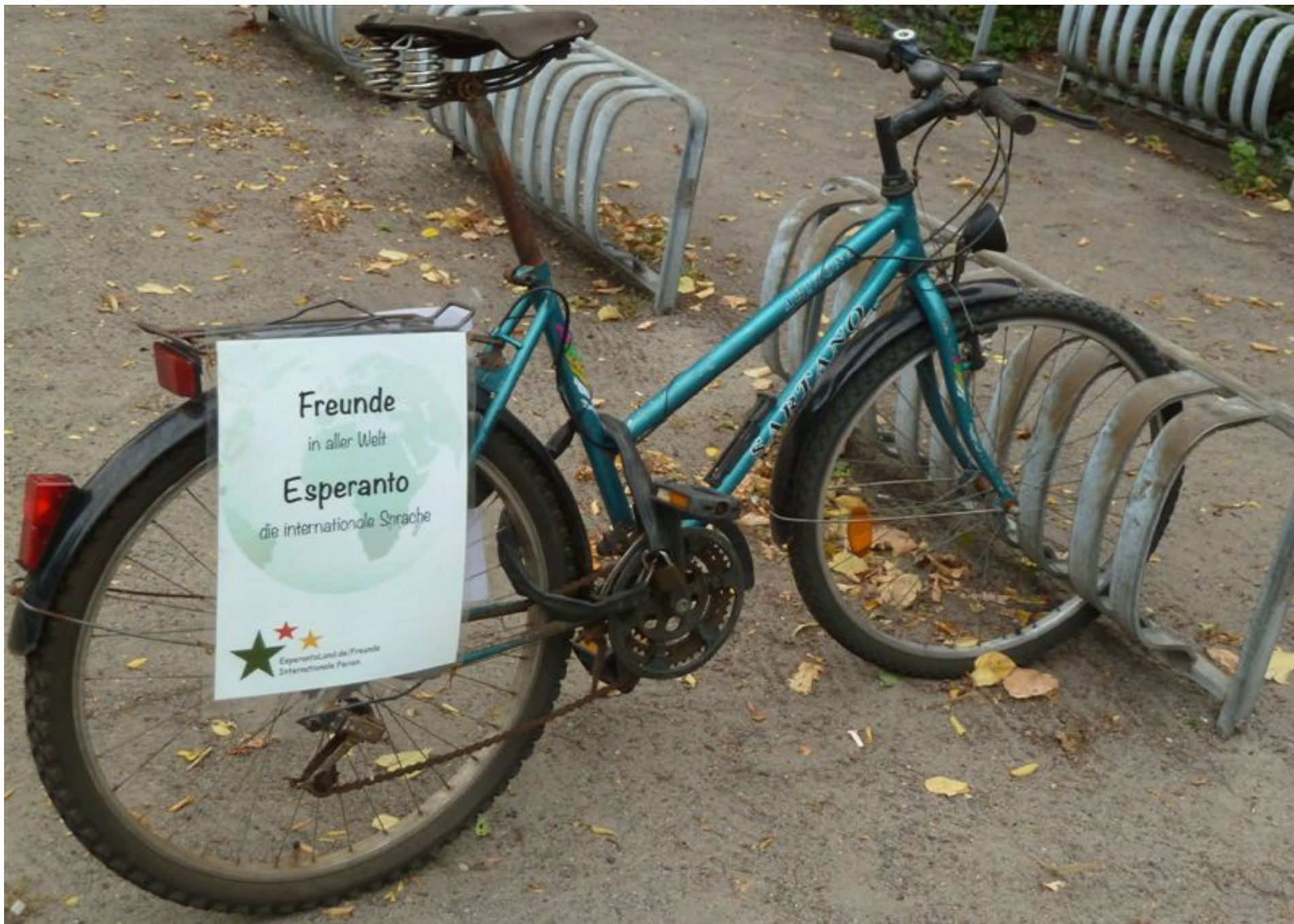
Lu Wunsch-Rolshoven: Disvastiĝo de novaj aferoj